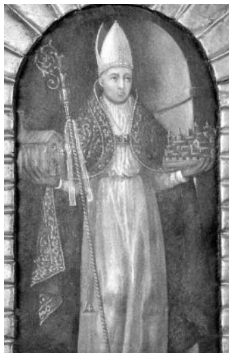
MDU, retauló de l'urna de fusta, segle XVII. Figura de Sant Ermengol

L'any 1010 els comtes Ermengol d'Urgell, Bernat de Besalú i Ramon Borrell de Barcelona encapçalaren una expedició a Còrdova. Eren nombrosos els clergues que acompanyaren els expedicionaris, entre d'altres el bisbe de