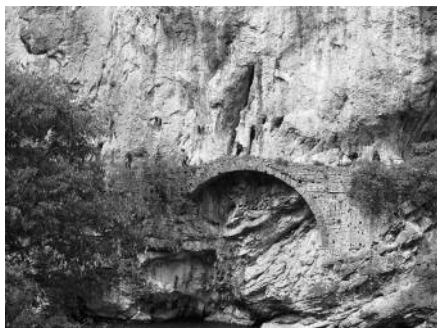
Els pontarrons del congost de Trespunts

de camins i la construcció de ponts, que van permetre millorar substancialment la viabilitat al llarg de la vall del Segre i, per tant, articular molt millor el territori de la capçalera del bisbat d'Urgell. L'impuls de la construcció de camins i ponts acostava el bisbe a les necessitats més quotidianes dels seus fidels –no sempre compartides pel seu entorn clerical– i impulsava el desenvolupament del comerç i l'increment de la riquesa de la diòcesi. Li són atribuïdes les obres del camí de Trespunts, per tal de millorar el pas del congost, i la construcció del Pont de Bar, on trobà la mort. Val a dir que en tots dos casos, els camins construïts o millorats pel