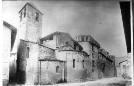
Sant Miquel de la Seu d'Urgell

Ponts l'any 1024, en el qual l'abat de Santa Cecília d'Elins reclamava al bisbe Ermengol l'església de Cortiuda, a l'actual municipi de Peramola, i els delmes del castell de Castelló. La fama d'aquest plet és deguda a dos factors determinats: d'un costat, pel fet de ser representat a un quadre de l'obra dramàtica El Retau-le de Sant Ermengol , que es representa cada estiu als claustres de la catedral de la Seu d'Urgell, i de l'altre, pel fet que deu ser la primera vegada que es parla de l'antiga acta de consagració de la catedral d'Urgell, un document fals